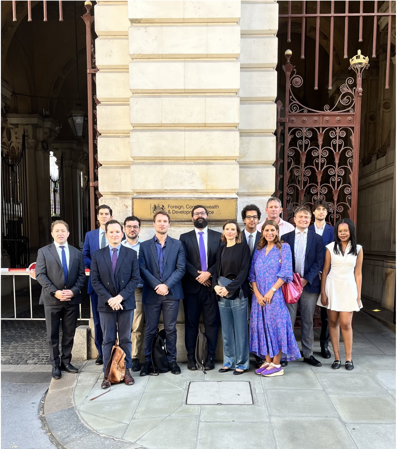
Young and Local Leaders met for policy discussions at the Foreign, Commonwealth and Development Office in London on 3rd July 2025 ahead of the summit on 10th July